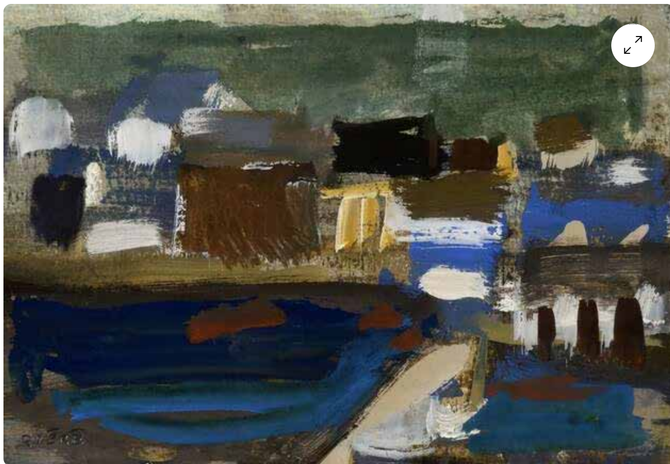
Ile de Sein, Dessin, René Quéré.

De son œuvre, ressort « le côté humain ». « C'était aussi un peintre libre, dont l'univers allait au-delà du monde maritime. Certaines de ses œuvres tendaient vers l'abstrait », salue Philippe Théallet, de la galerie éponyme à Quimper.